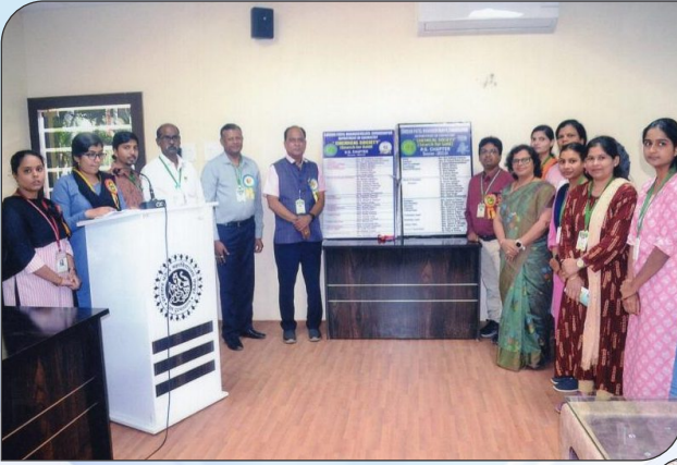
Principal and Staff members along with students during inauguration of Chemical Society