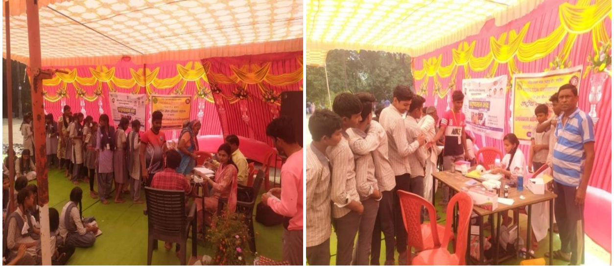
On the occasion of World Youth Day Ayushman Bhava Health Care Card Camp, campers and villagers making health card at National Service Scheme College Special Camp from 12th January onwards.