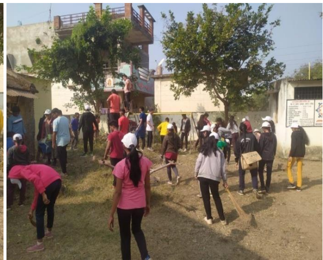
Campers cleaning the village during the National Service Scheme College Special Camp at Varur Road village from 11th January to 13 th January 2024.