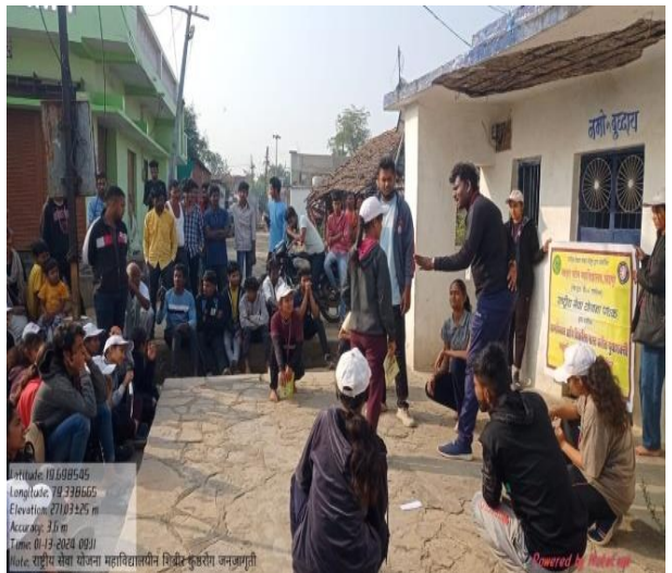
On January 13, 2024 at Warur Road Village National Service Scheme College Special Camp Campers creating awareness among the villagers on leprosy and Save Water through street play.