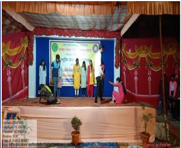
8 th January to 14 th January 2024 in Warur Road Village, National Service Scheme College Special Camp Campers creating awareness among the Villagers through cultural programs on various subjects.