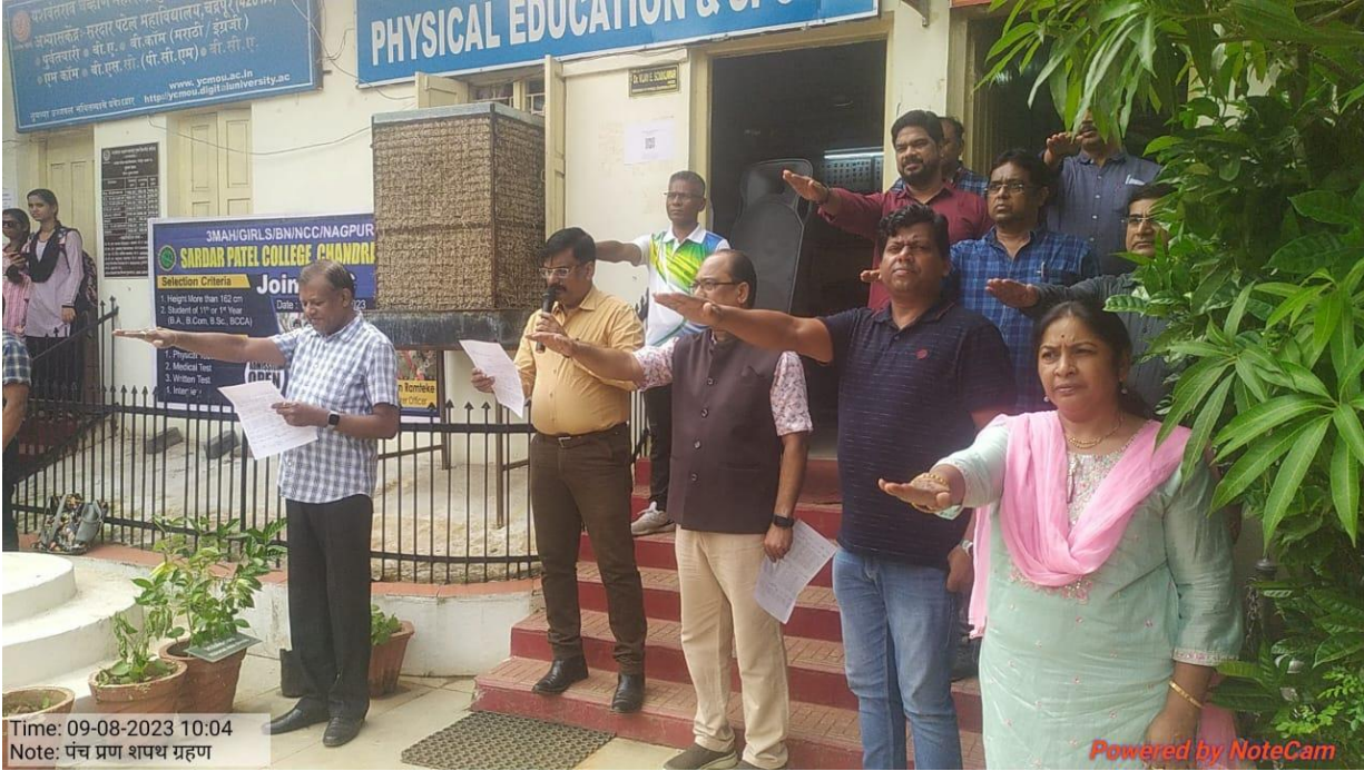
Time: 09-08-2023 10:04 Note: पंच प्रण शपथ ग्रहण