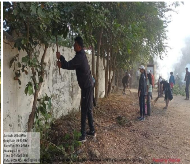
Campers cleaning the village during the National Service Scheme College Special Camp at Varur Road village from 11th January to 13 th January 2024.