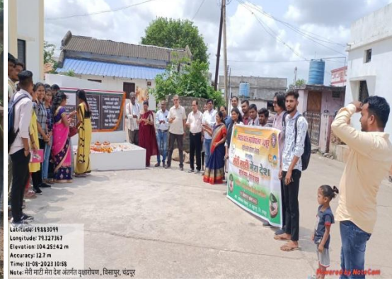
Latitude: 18883991 Longitude: 79227917 Elevation: 204265.42 m Accuracy: 12.7 m Time: 11-08-2023 10:58 Note: मेरी माटी मेरा देश अंतरित पृथ्वीप, विसापुर, धंनूर