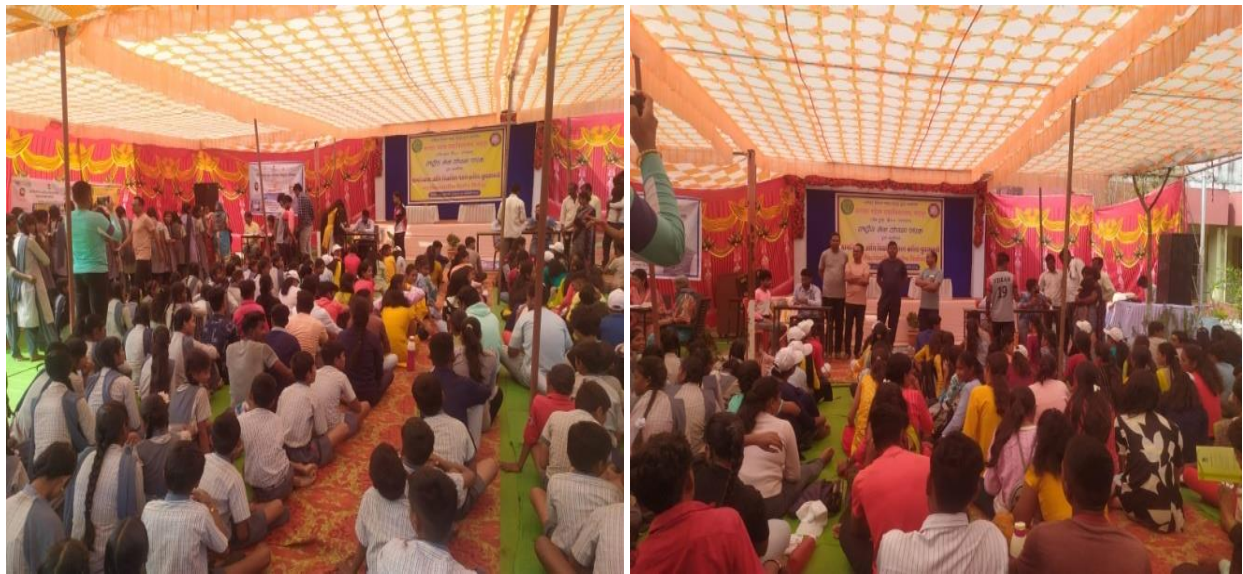
Campers and villagers participating in Sickle Cell and Diabetes BP Testing Camp on the occasion of World Youth Day at National Service Yojana College Special Camp at Warur Road village on January 12, 2024