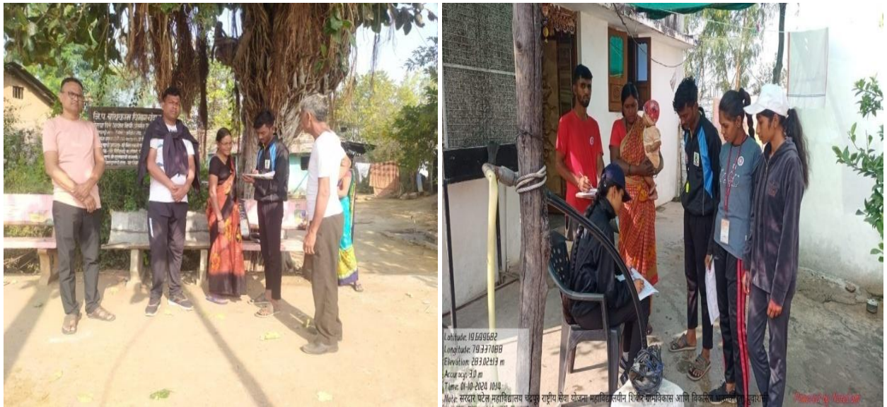
From January 9th to January 10th, 2024, in the National Service Scheme College Special Camp, Warur Road village, the campers were conducting a University survey in your village.