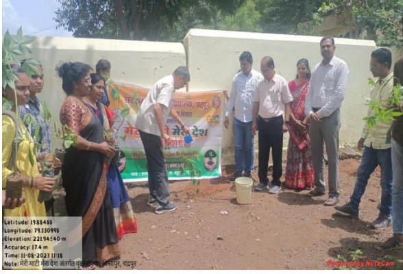
Latitude: 1888455 Longitude: 79227917 Elevation: 22154.540 m Accuracy: 12.7 m Time: 11-08-2023 11:18 Note: मेरी माटी मेरा देश अंतरित पृथ्वीप, विसापुर, धंनूर