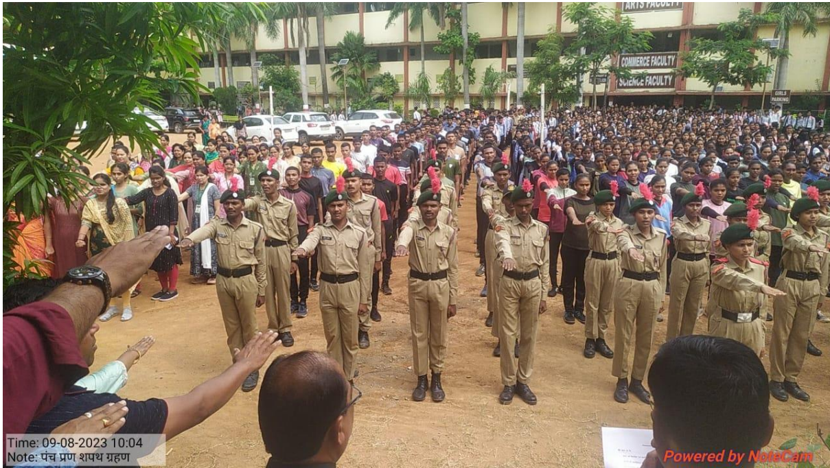
Time: 09-08-2023 10:04 Note: पंच प्रण शपथ ग्रहण