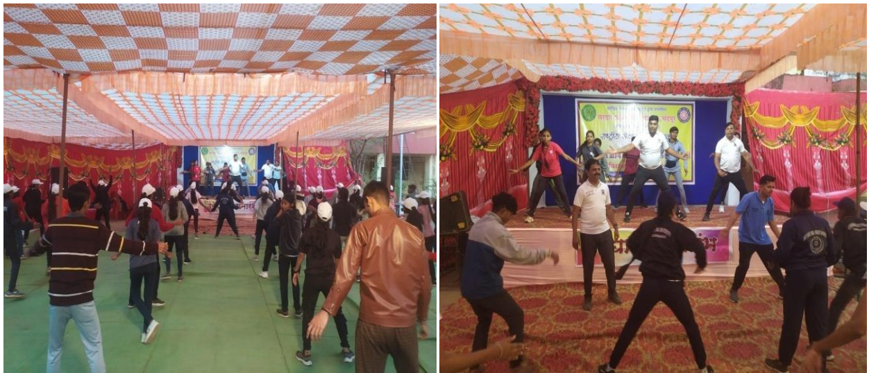
From January 8 to January 14, 2019, campers studying yoga and dance in the college special camp of National Service Scheme at Warur Road village.