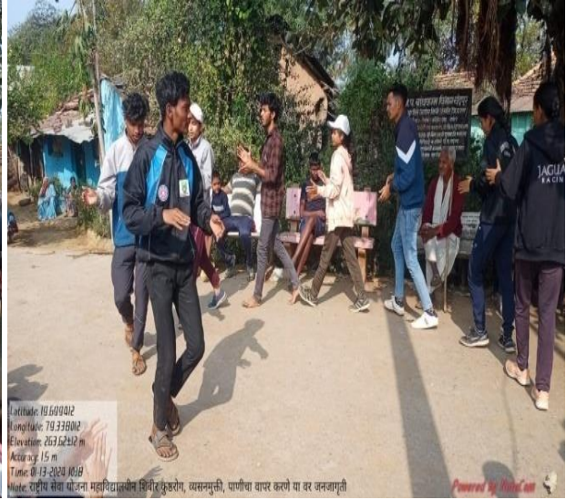
On 13th January 2024 at Warur Road village National Service Scheme College special camp campers creating awareness among the villagers on leprosy and drug addiction and addiction free through street play.